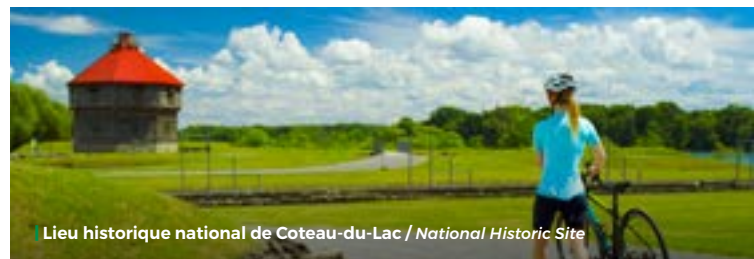
Lieu historique national de Coteau-du-Lac / National Historic Site

B Village des Écluses Terrains de camping et prêt-à-camper Campground and ready-to-camp sites Pointe-des-Cascades (CITQ 199603)